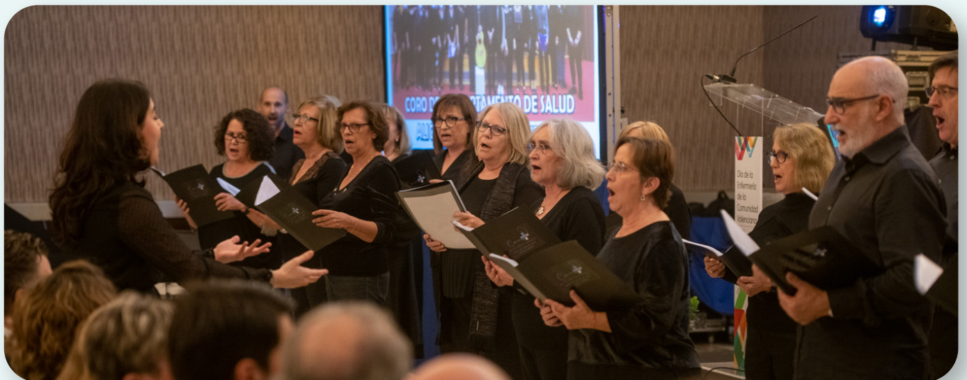
El Coro del Departamento de Salud Alicante-Hospital General interpretó varios temas, entre ellos, el himno de la profesión de Enfermería española, Allí estaré, obra de Íñigo Lapetra