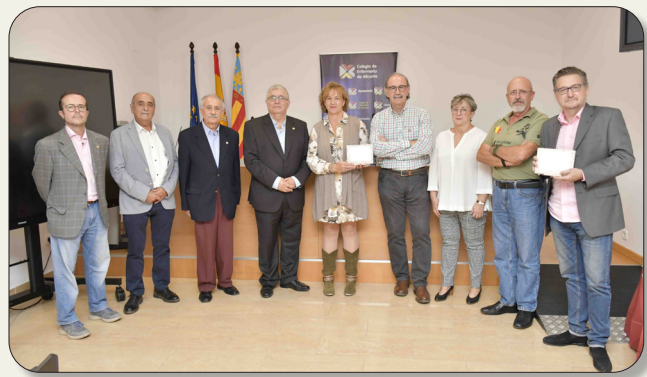
Imagen de los representantes de ambas juntas de Gobierno